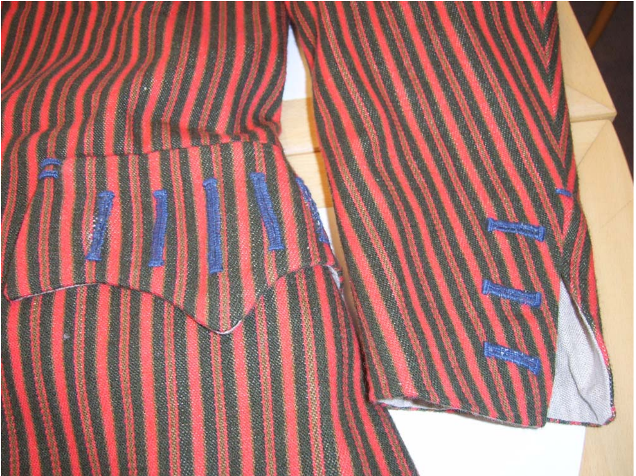
Figur 2 Den rekonstruerede trøje viser de håndværksmæssige kompetencer der ligger bag udførelsen af trøjen ved blandt andet at tælle ikke mindre end 32 håndsnyede knaphuller. Derudover kommer en række tresser der forstærker lommer og slidser