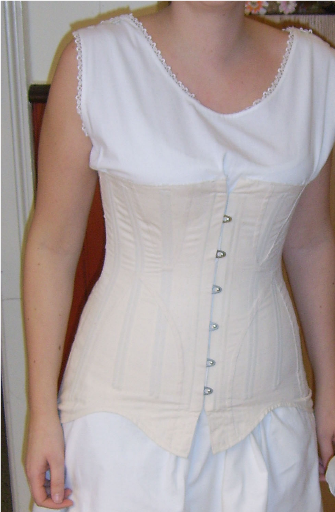
Figur 3 Det rekonstruerede korset der kræver særlige tilskærings og sytekniske kompetencer