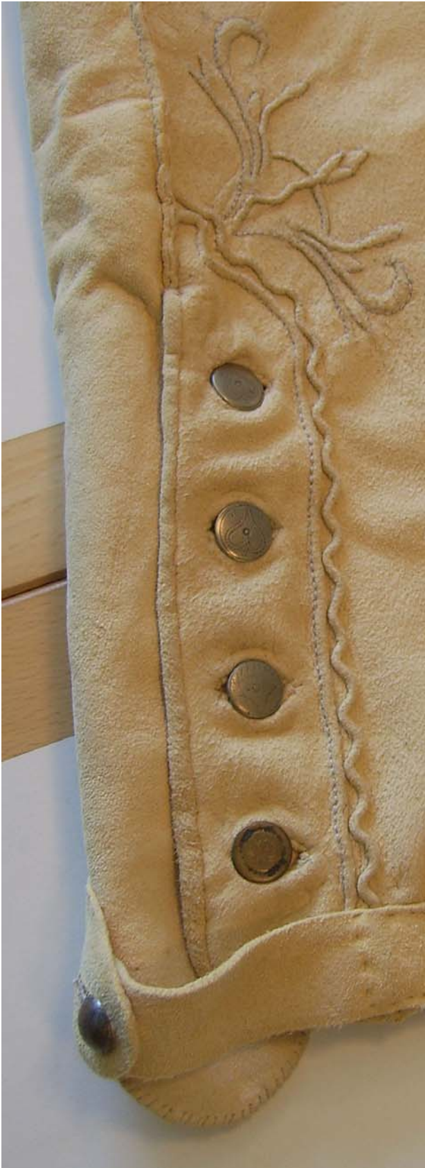
Figur 1. De rekonstruerede håndsuede skindbukser. Bemærk de fine små jævne sting, samt den ophøjede syning, og kastesting rundt i "overfaldet" ved knaplukningen nederst på buksebenet. Alle stingtyper vidner om et par håndsuede bukser.