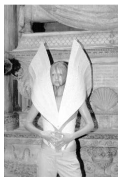
Fashion in Motion, V&A