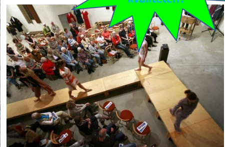
Historisk modeshow, Forskningsdøgn, Textilforum, 2009