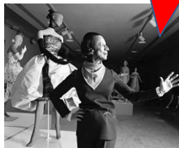
Diana Vreeland (1903-1989), specialkonsulent, The Costume Institute, The Metropolitan Museum of Art, New York.