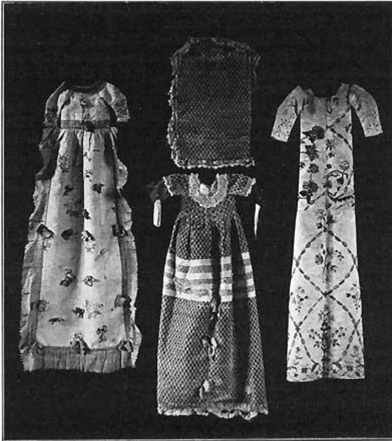
Fig. 7. a, b, c. Kristentøj (a ukendt, b fra Hammeløggen, c fra Aaby). Fot A. Johansen.

Fig. 7 c er af svært, elfenbensfarvet Silkedamask med Silkedamask med Silkebroderi, hvis lette, spinkle Tegning og smukke, dæmpede Farver henfører det til Louis XVI Tiden. Sømmensyningerne foroven og den meget slanke »Linie« fortæller, at der ikke har været altfor rigeligt af det smukke Stof til Raadighed. Ejendommeligt virker de helt løse Ærmer.