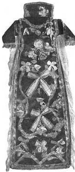
Fig. 6. Kristentøj fra Benzon.