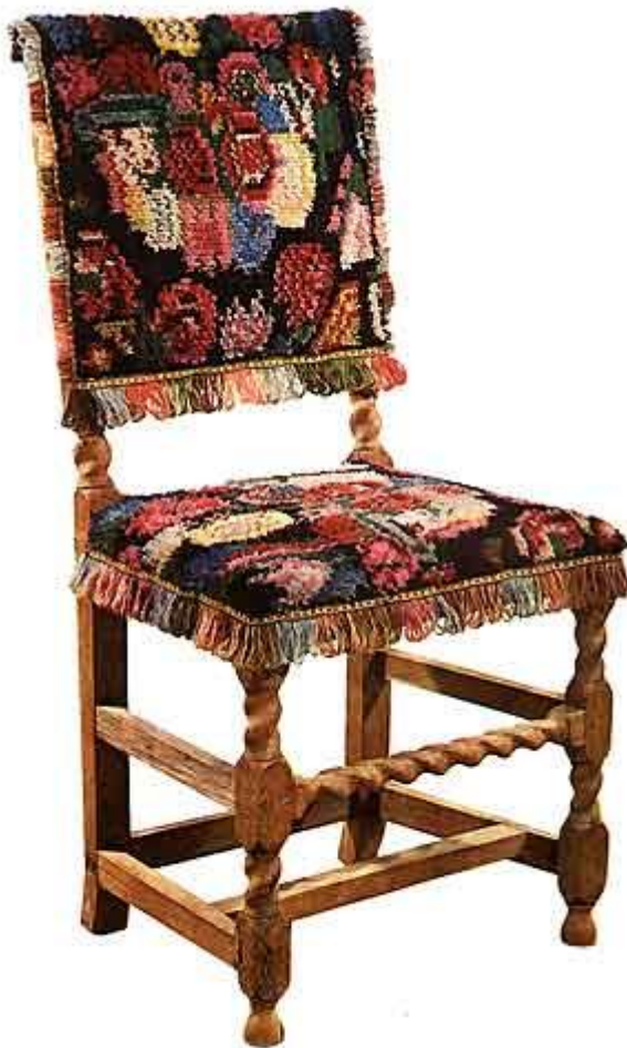
Fig. 1. Barokstol med kopi af det originale betræk i Turkey-work (mus. nr. 63:15).

Forklaringen på det fremmede navn for denne art flosvævning er enkel – næsten klassisk. Det startede med, at tæpper fra Østen eller den nære Orient blev mode i de højere kredse i Frankrig og England i 1500'årene. De tyrkiske mønstre med de kantede omrids [62|63]