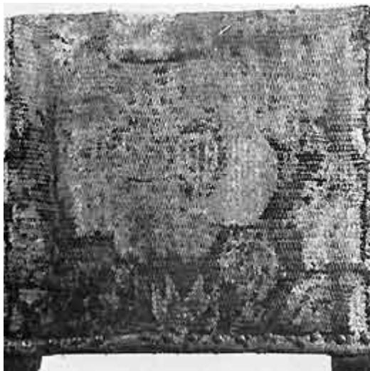
Fig. 2. Forside af stoleryggen med det afslidte, originale betræk.

Endelig har det hele været fastgjort med en række store, støbte messing-kopsøm, hvis overflade er poleret. Den slags findes ikke mere som lagervare. Derimod havde 1600'årenes købmænd adskillige typer på søm i deres lagre 5 ). Nu vil kopsømmene blive lavet specielt til denne stol. [64|65]