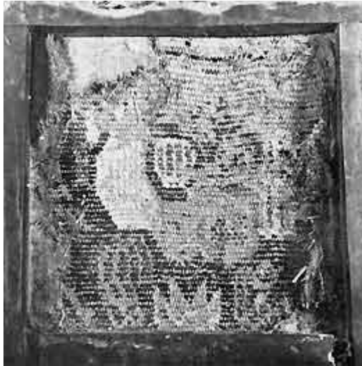
Fig. 3. Bagside af samme.

[65|66] Det kan tilføjes, at man – ved at se den færdige stoleryg med de varme mættede farver – besluttede at få vævet sædet i samme mønster, uanset at man ikke ved, om det har været lige sådan. Da sædet foran var bredere end ryggen og den samme trend skulle benyttes, blev vævningen ved påsætningen vendt en kvart omgang. Utvivlsomt har man heller ikke taget tungt på den slags i datiden. Stolen er nu istandsat, og med sin overlæssethed distancerer den væsentligt fra de flestes æstetiske opfattelse i dag. Men den giver et levende indtryk af baroktiden og det, man ønskede at omgive sig med i det velstående borgerskab – formentlig i Århus – og det var det, der var målet med restaurering og genfremstilling.