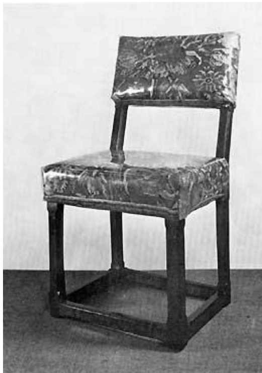
Fig. 7. Renæssancestol med betræk i Turkey-work. Victoria and Albert Museum.